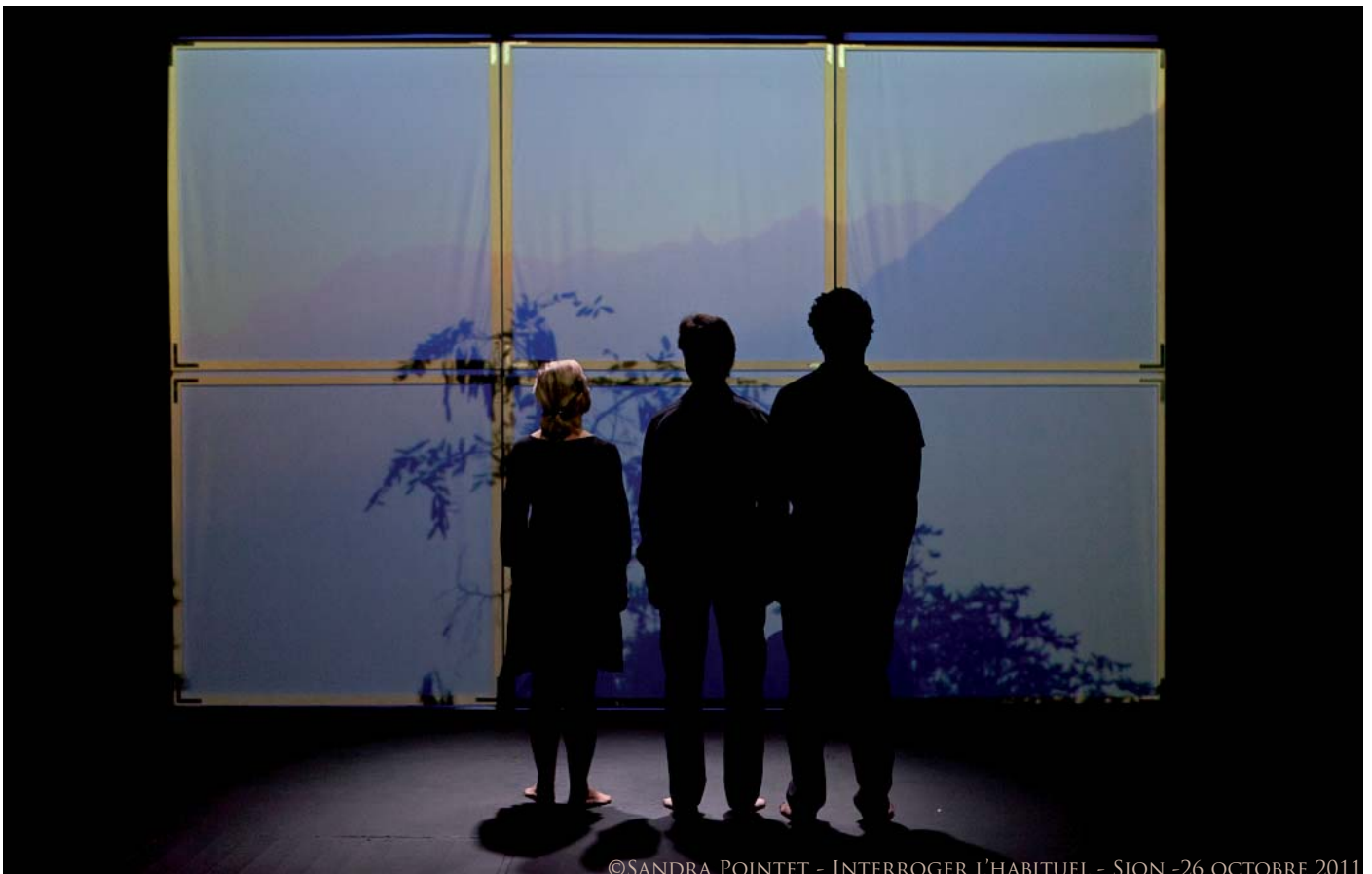
©SANDRA POINTET - INTERROGER L'HABITUEL - SION - 26 OCTOBRE 2011

CONTACT : ERIKA WIGET, 076/556 71 07, INFO@CIE-ANADYOMENE.COM