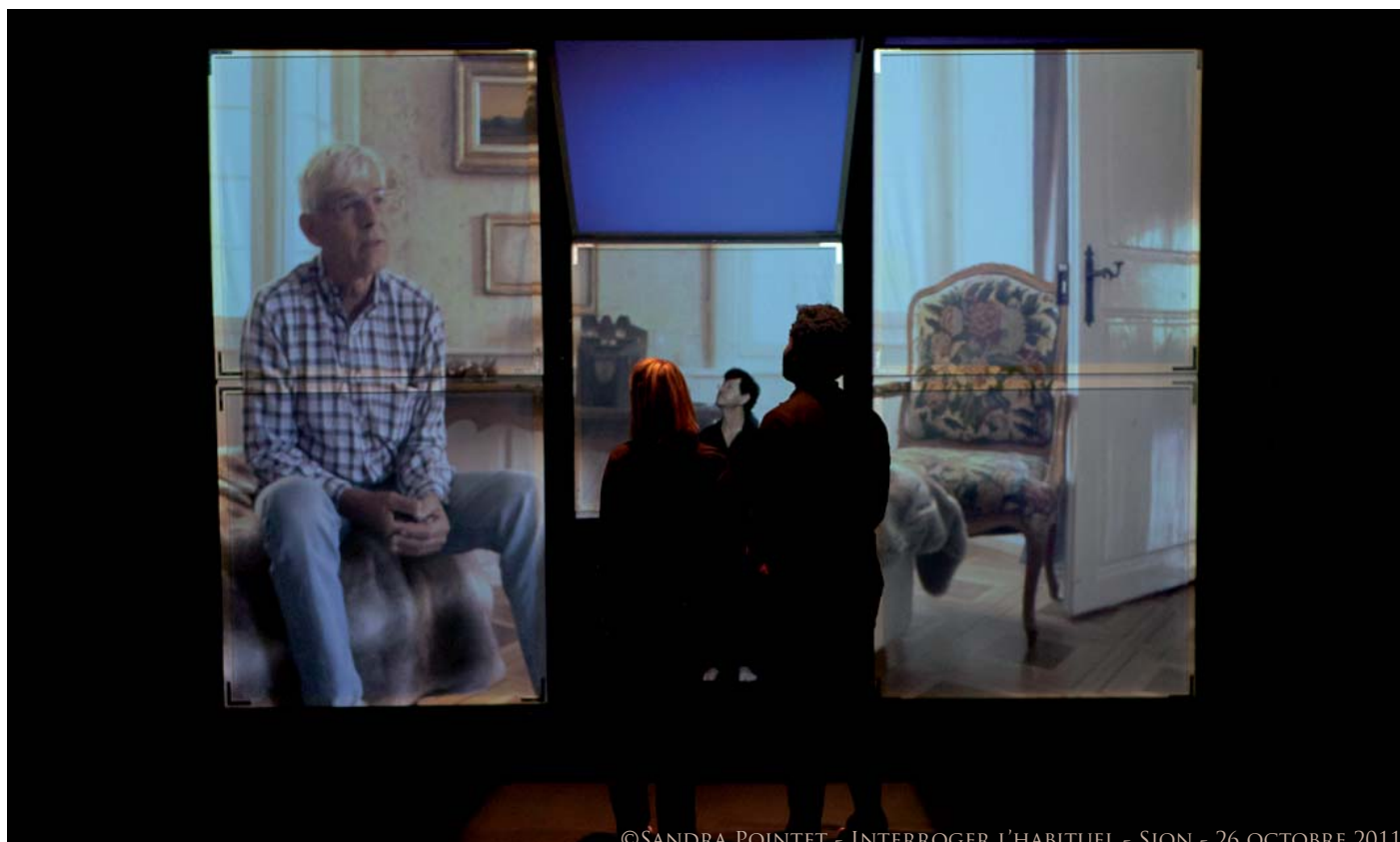
INTERROGER L'HABITUEL - SION - 26 OCTOBRE 2011

·PORTFOLIO IMAGES WWW.CIE-ANADYOMENE.COM